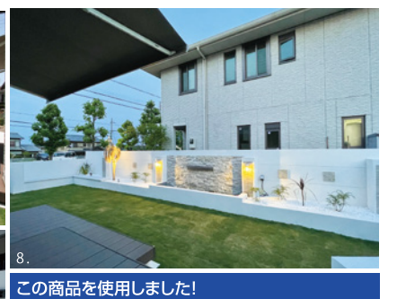
この商品を使用しました!

1.数字の7をモチーフにしたインパクトあるカーポート。2.素材感の違うタイルを組み合わせスタイリッシュに。3.循環式の滝で憩いの空間を。4.7.ライティングでアプローチを演出 5.8.広いウッドデッキと滝でリゾート感を演出。6.ヤシの木がファサードを演出。