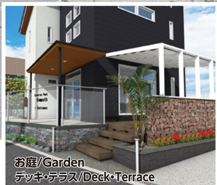
お庭/Garden デッキ・テラス/Deck・Terrace