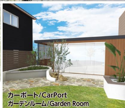
カーポート/CarPort ガーデンルーム/Garden Room