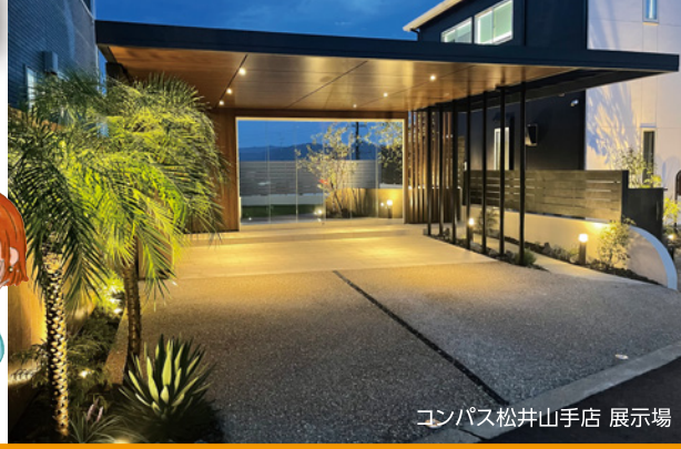
コンパス松井山手店 展示場