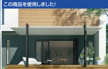
この商品を使用しました！ テラスならではの開放感と、家族が集えるリビングの快適さ。ふたつを併せ持つ「軒」のような空間 [リクシル/テラスSC]