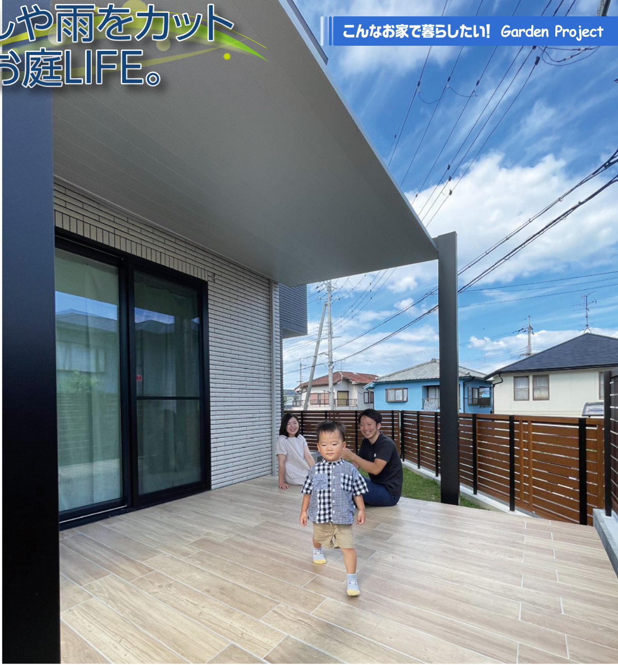
こんなお家で暮らしたい! Garden Project