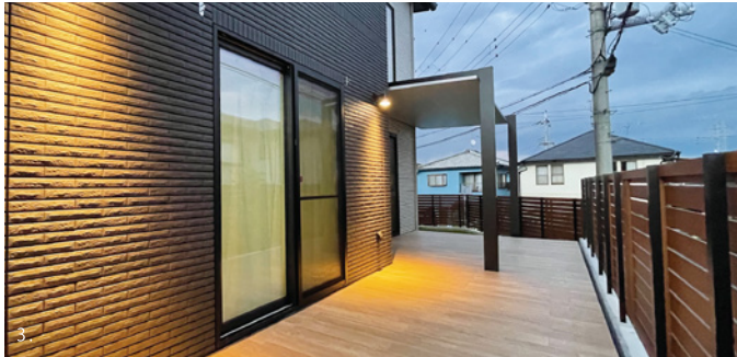
1.2.リビングから続く大きなテラスは広々、お子様にも安全。3.7.大きな屋根で開放感抜群。照明も設置し夜でも利用できます。4.6.門柱は大きいサイズのタイルを使用し存在感を。5.階段は使いやすい高さで設計。手すりも設置し、安全性にも配慮しています。