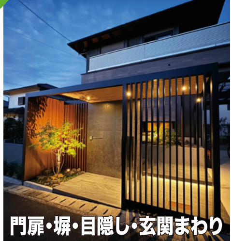
門扉・塀・目隠し・玄関まわり