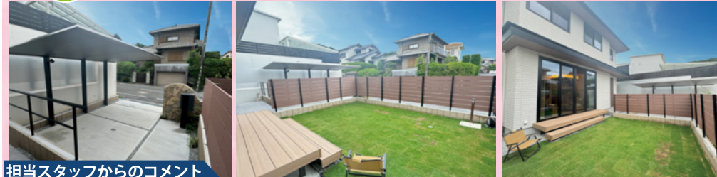
担当スタッフからのコメント

新築外構とお庭のプランをご依頼いただきました。門柱は石積調の天然石貼で、角を落として自然な感じに仕上げました。カーポートは人気の三協アルミのFII、シャープですっきりと。屋根部分と柱部分の色違いがおしゃれです。芝生はTM9、一般的な芝生より緑が美しく、メンテナンスも楽です。木彫の板塀のフェンスで目隠ししつつ、外構との統一感を出しています。ナチュラルですっきりとした素敵なお家に似合った外回りが出来上がりました。この度はありがとうございました。