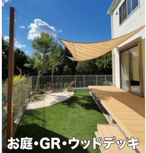
お庭・GR・ウッドデッキ