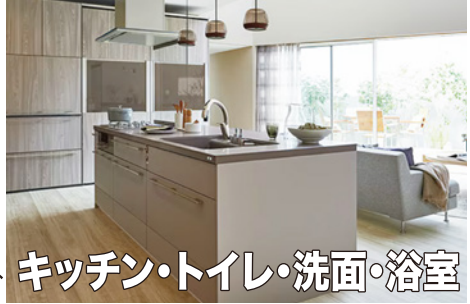
キッチン・トイレ・洗面・浴室

LIXIL 自然にやさしい、やさらぎの空間 YKK AP 四国化成 EXTERIOR など主要金物メーカーから4月1日以降大幅な値上げが予定されています。値上げになる前に、購入できる最後のチャンスです。カーポートを取り替えたり、玄関まわりをきれいにしたたり、キッチン、浴室、トイレなどのリフォームをお考えの方は、ぜひこの機会にお近くのコンパスにご相談ください。