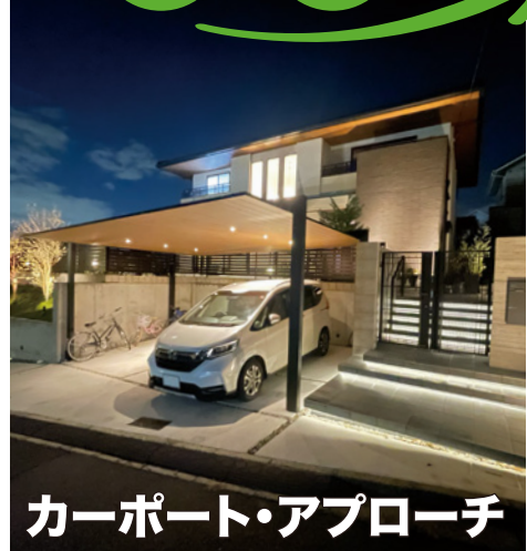
カーポート・アプローチ